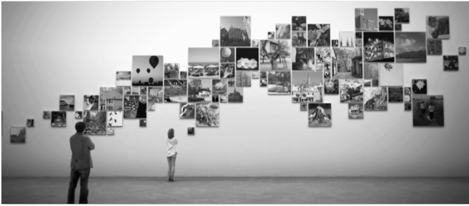
Abbildung 3: Rundgang durch das virtuelle »Museum of me«.