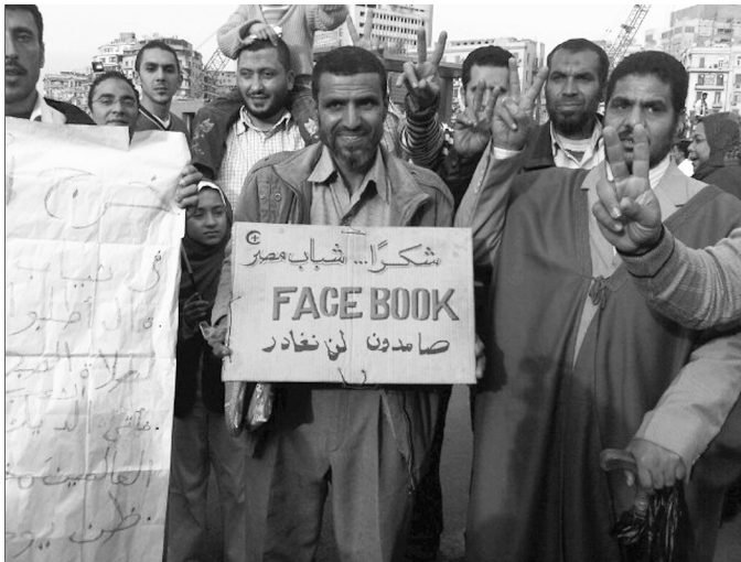
Abbildung 1: Demonstranten auf dem Tahir Square in Kairo Anfang Februar 2011. Auf dem Schild steht: »Danke, Jugend Ägyptens – Facebook – Wir, die Unerschütterlichen, werden nicht weichen«.

noch darum drehte, welchen Anteil, quasi in Prozent, Facebook am Aufbruch habe.