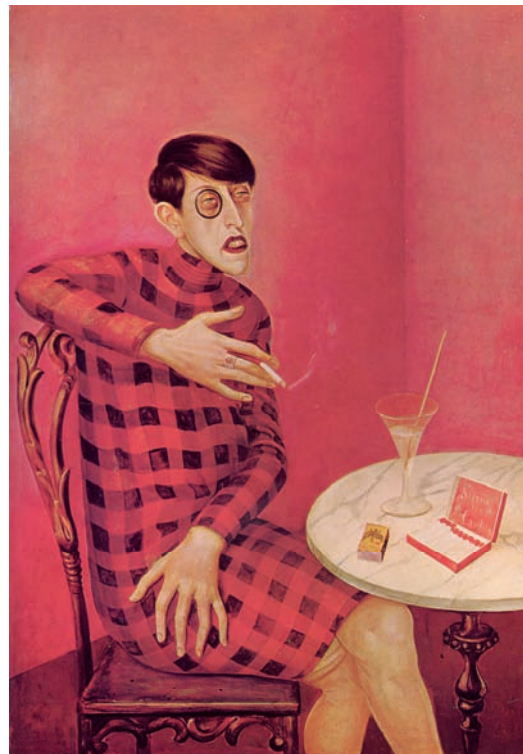
Abb. 3 Otto Dix: Bildnis der Journalistin Sylvia von Harden, 1926, Öl und Tempera auf Holz, 121 x 89 cm, Centre Pompidou Paris

War die Zigarette im 19. Jahrhundert mit den Haremsdamen und Prostituierten auf der einen Seite verbunden, so auf der anderen Seite mit weiblicher Emanzipation, die als Vermännlichung der Frau herabgesetzt wurde. Karikierende Postkarten um 1900 zeigen rauchende Frauen als Teil der Frauenbewegung, deren Ziele als absurde Umkehrung der Geschlechterverhältnisse verspottet wurden Abb. 2 (siehe folgende Seite). Noch bis ins 20. Jahrhundert haftete rauchenden Frauen etwas Anrühiges und Provokatives an. In Else Urys Erzählung Studierte Mädel (1905) etwa erfährt die paffende Gymnasiastin Hilde Dahlen, dass ihre Freundinnen Rauchen »greulich emanzipiert« finden, und der Lehrer Doktor Werner ist über Hildes Verhalten entsetzt: »Sie rauchen, Fräulein Dahlen? ich hätte Sie nicht für so unweiblich gehalten«. 3