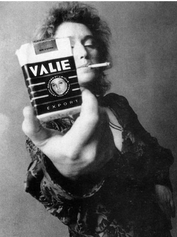
Abb. 4 VALIE EXPORT: VALIE EXPORT – Smart Export, 1967–1970, S/W-Fotografie

Die Zigarette als Zeichen des »Gender Trouble« und der weiblichen Emanzipation verliert auch in der zweiten Hälfte des 20. Jahrhunderts nicht an Wirkungsmacht. »VALIE EXPORT« ist als Logo auf einer Zigaretenschachtel zu lesen, als Markenzeichen der Künstlerin, die sie auf der Fotografie VALIE EXPORT – Smart Export Abb. 4 vorzeigt und dabei auf verschiedenen Ebenen mit Identitäten spielt: VALIE EXPORT posiert nach einem Schema für Männlichkeit, indem die Zigarette lässig im Mundwinkel hängt. Zugleich aber rufen der laszive Blick und der tiefe Ausschnitt der Bluse Weiblichkeitsschemata auf. In den 1990er Jahren wird die Zigarette Attribut von Sarah Lucas in den Self Portraits Abb. 5 , in denen sich diese Künstlerin »trotzig, provokant, in Kerlsposen, aber auch als Objekt der Begierde« mit übermarkierten Symbolen präsentiert. 7 So machen sich beide Künstlerinnen die Doppelcodierungen der Zigarette zunutze, die auch Zeichen eines sexuellen Selbstbewusstseins sein kann.