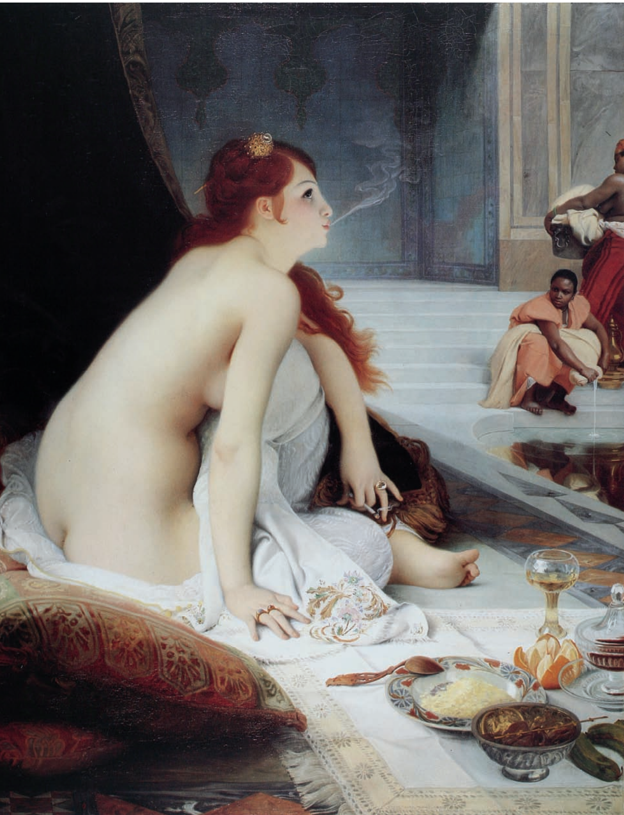
Abb. 1 Jean-Jules Antoine Lecomte du Noüy: Die weiße Sklavin, 1888, Öl auf Leinwand, 149 x 118 cm, Nantes, Musée des Beaux-Arts