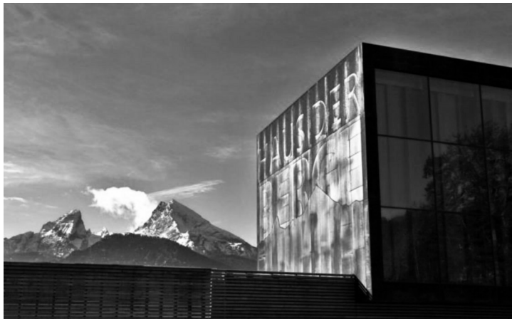
Abbildung 2: Haus der Berge

konkret. 11 Das Haus der Berge im Nationalpark Berchtesgaden ist solch ein Beispiel. Das 2013 eröffnete Science-Center informiert die Besucher über die Natur- und Lebensräume der Umgebung; im geschützten Raum kann man den Verlauf der Jahreszeiten verfolgen und sich über die Tiere des Parks auf Touchscreens informieren lassen. Verschiedene Lichtstimmungen imitieren auf- und untergehende Sonne innerhalb der künstlichen Berglandschaft. Diese »Vertikale Wildnis«, so der Name der Ausstellung, befindet sich in einem großen Kubus, der an zwei gegenüberliegenden Seiten von ganzflächigen Panoramaglasscheiben eingefasst wird. Anders als man vermuten könnte, hat die Glasscheibe hier nicht die Aufgabe, wie bspw. im gläsernen Wintergarten Ludwigs II., immersiv zu wirken und den Besuchern eine künstliche Landschaft unter realem Himmel zu suggerieren. 12 Damit die Ausstellung funktioniert, muss die Scheibe verdunkelt werden. Für die Außenansicht wird sie dadurch zum Spiegel: die verhinderte Einsicht führt zur Spiegelung der Umgebung, der »realen Berge« in der Fassade des Hauses.