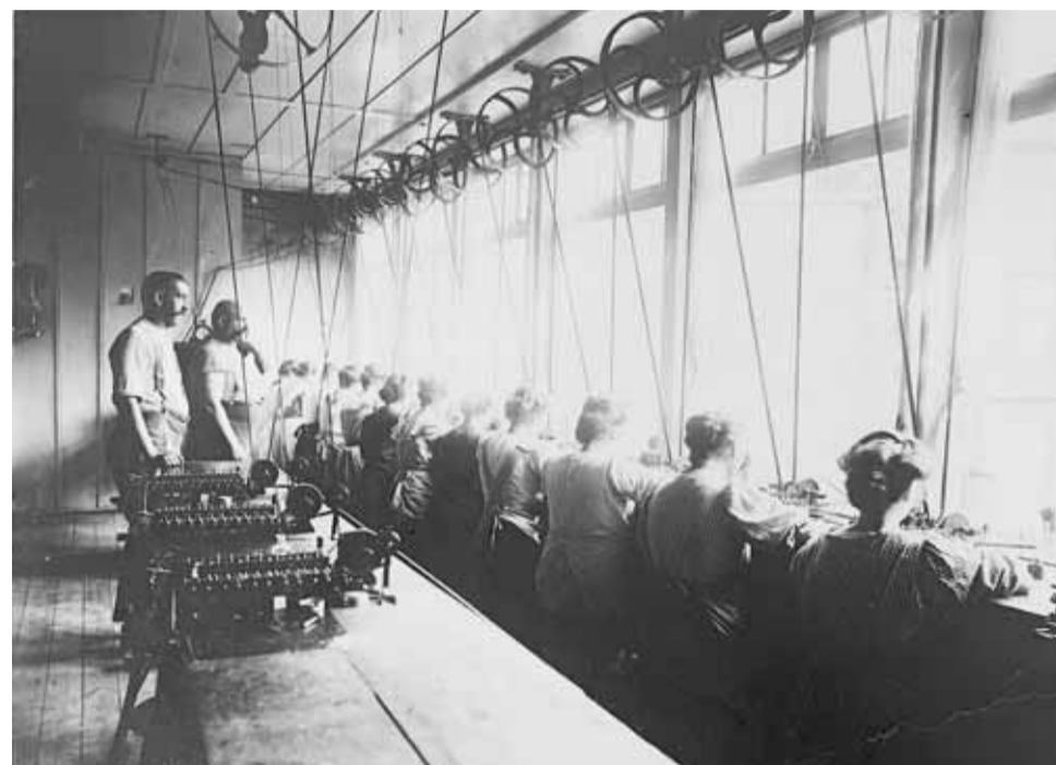
Fabrikarbeiterinnen und Aufseher in einer Uhrenfabrik im Berner Jura, Ende 19. Jahrhundert. Die Maschine gab den Arbeitsrhythmus vor.

Die Eisenbahn, die Globalisierung, den technologischen Wandel, auch nicht die Maschinen. Sie waren überzeugt, dass diese Prozesse nicht aufzuhalten waren. Sie sahen aber die Gefahr, dass dies alles die sozialen Gegensätze noch grösser lassen würde. Also setzten sie diese Mittel für die internationale Vernetzung ein – um eine alternative Globalisierung zu ermöglichen, um die sozialen Probleme über einen globalen Ansatz zu lösen. Das schlägt den Bogen zur heutigen Bewegung, die eine alternative Globalisierung fordert: Diese ist genauso weltweit vernetzt, lehnt den Staat als Handlungsrahmen ab und sucht globale Handlungsansätze.